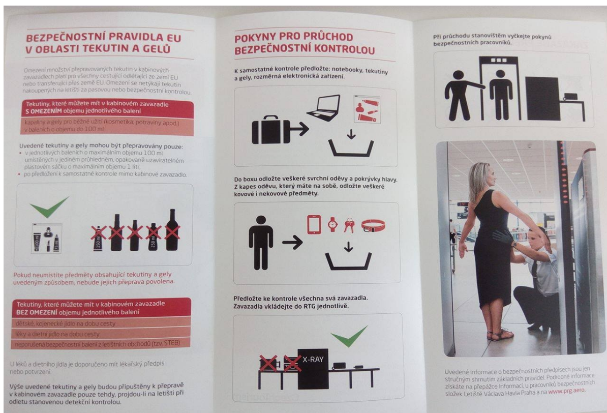
Obr. 1 – Zpracování bezpečnostních pravidel